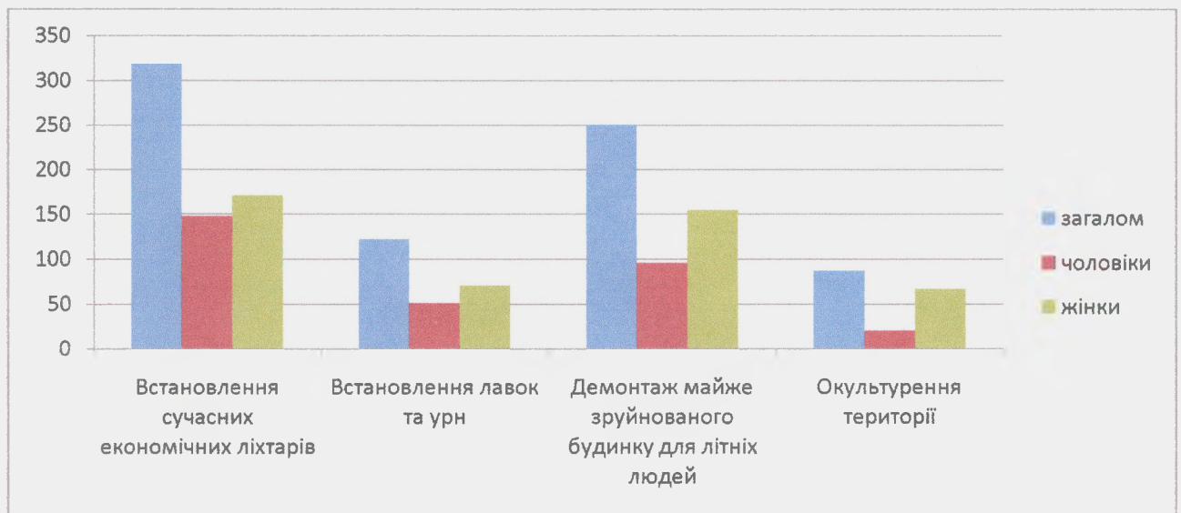
Рис.1. Результати опитування жителів громади

За даними анкетування було визначено, що саме необхідно в першу чергу для благоустрою даного скверу (рис.1)