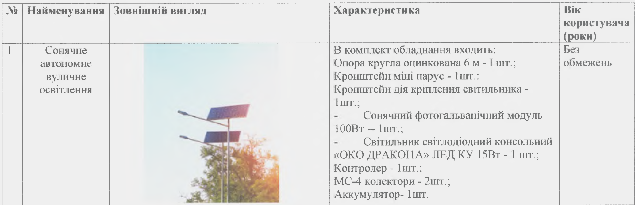
Таблиця із зазначеними характеристиками